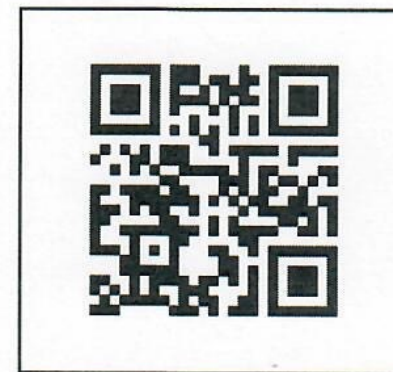
แบบฟอร์มขอรับทุนการศึกษา